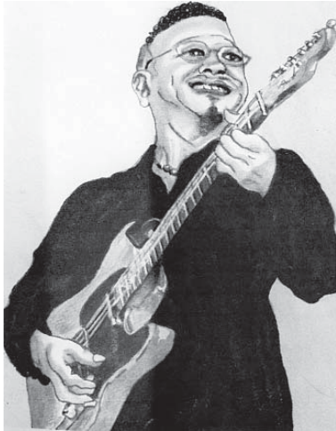
ピーちゃん。ありがとうございます。

4 よく飯高先生の書を表装していました。今の仕事と先生と縁があると思っています。高校卒業後はどうでしたか？ 英語をマスターしようとする専門学校へ行きましたが、夏休みにバンドのアルバイトに夢中になり過ぎて、学校を中退しました。その後は波瀾万丈でした。 5 演奏で一番良かったことは何ですか？ 演奏を通して好きなことが続けられることです。また、音楽を通して、いろいろな人と出会えたことですかね。 6 音楽(演奏)の魅力は何ですか？ 自分が弾くことによって、私と同世代や先輩の方が、「青春に帰ることができた」と喜んでもらえることです。 7 仕事と演奏の両立はどうでしたか？ 現在、画材や額縁、画廊の仕事をしています。芸術つまり絵画や音楽は似ているので両方ともやりがいがあります。お客さんの中には、ジャズを聴きながら日本画を描いている人もいますから。 8 これからどんな演奏をしたいですか？ ブルースを主体に、お客様に喜んで頂ける演奏活動ができれば嬉しいです。